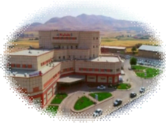
بیمارستان شاه شہرستان ستر

در مواردیکه جنین زنده ولی دارای دیسترس دکولمان شدید یا پیشرونده، خونریزی غیر قابل کنترل از یک رحم دارای انقباض و اتساع سریع رحم در اثر خونریزی مخفی بدون نزدیک بودن زمان زایمان وجود داشته باشد سزارین اورژانسی انجام می شود ولی در مواردیکه دکولمان خفیف و غیر پیشرونده و جنین مرده است زایمان طبیعی اندیکاسیون دارد.